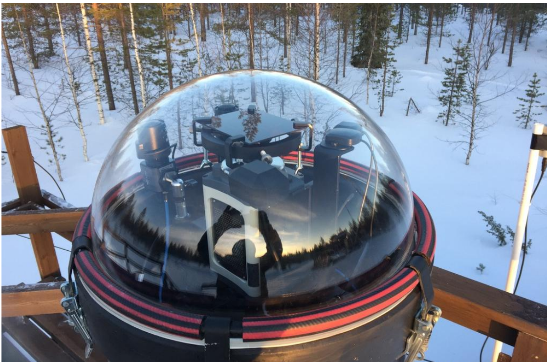
図 1: フィンランドのソダンキュラにおいて運用されている EMCCD 全天カメラ（中央部分）。 1 秒間に 100 枚のオーロラ画像を取得することができます。

本研究は、フィンランド北部のソダンキュラで運用されている高感度・高時間分解能の電子倍増型 CCD（EMCCD）全天カメラ（図 1）と、同時刻に磁気圏を飛翔していた「あらせ」の観測データを組み合わせることによって実施されました。EMCCD 全天カメラは、コンピュータによる自動制御によって連続的に観測が行われていますが、本成果は、2017 年 3 月に「あらせ」がカメラの視野内において観測を実施した際に得られたデータを解析することによって得られました。