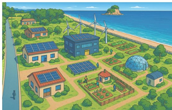
珠洲のランドマーク「見附島」と、自律分散型コミュニティブランドの実証イメージ

コミュニティの持続性が確保できる レジリエンスな地域形成モデルを構築 「災害に強いまちづくり」を実現