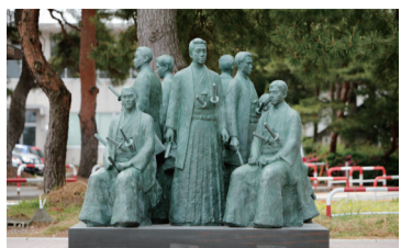
28 医学部創立百周年記念モニュメント 金沢医学部第一期生9名をモチーフにしたブロンズ像「医の源流 未来への継承」。金沢大学草創期の息吹をキャンパスで学ぶ学生たちに伝える。