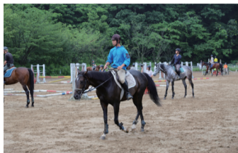
13 馬場 大学の馬場として全国有数の広さを誇り、厩舎では十数頭の馬が飼育されている。早朝には馬術部が障害越えの練習をする姿が見られる。