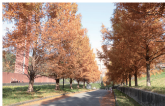
5 メタセコイヤ並木 総合教育講義棟と体育館を結ぶ通路両脇のメタセコイヤ並木は、春には新緑を、秋には黄金色からレンガ色への紅葉を楽しむことができる。