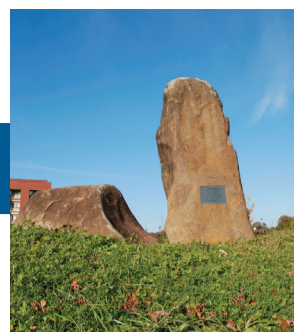
9 測地基準点の巨大な石 キャンパスの緯度・経度・標高を測定するためGPSアンテナが設置されている。継続測定することで地殻変動が分かる。