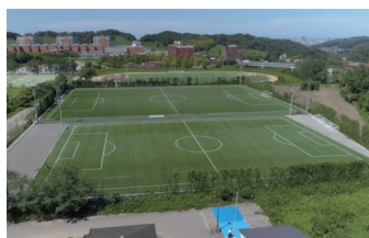
11 サッカー場、陸上競技場 授業や部活動に使用されているだけでなく、地域の子どもたちを対象としたスポーツ教室やイベント会場としても幅広く活用されている。