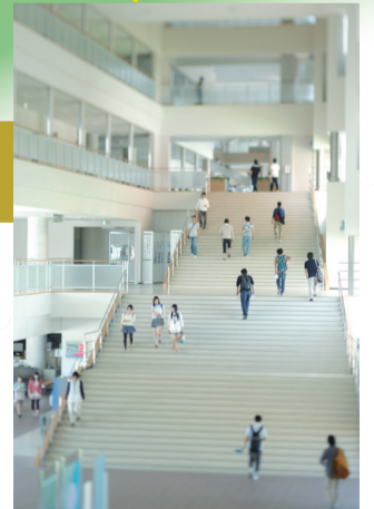
15 アカデミックホール 正面玄関入ってすぐのダイナミックな吹き抜けスペース。研究棟や講義棟へ向かう大階段と自然科学系図書館や食堂をつなぐ。