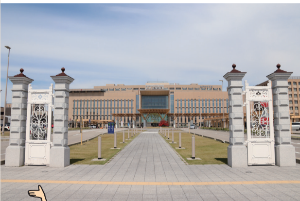
34 附属病院門柱 門柱は明治時代の正門を復元したもの。病院正面に樹齢300年の「のどけりんツツジ」の古木と赤松を植樹。