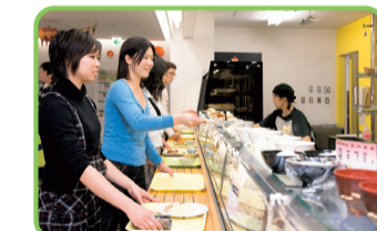
20 21 22 食堂 日替わりメニューが楽しめる。学生の憩いの場。 20 学生会館食堂 ◎11:00～13:30 ㊦土・日・祝 21 北福利食堂 ◎11:00～13:30 ㊦土・日・祝 22 南福利食堂 フレボ ◎11:00～13:30、17:00～19:30 ㊦土・日・祝