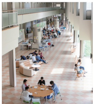
17 アカデミックプロムナード 学生たちの学修と憩いの場。テーブルには電源を備えており、無線LANでインターネットも使用可能。