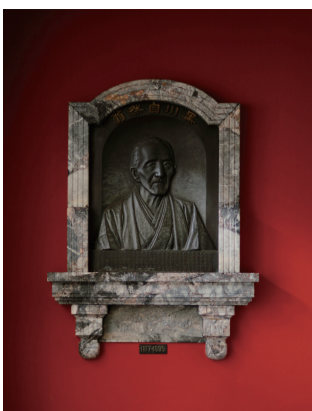
31 黒川良安像 金沢大学の源流である加賀藩彦三様を開設した蘭学者黒川良安。医学の知識・技術の修得に励む学生を見守っている。