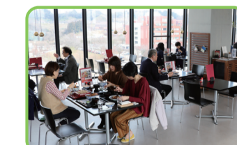
25 YABU&CAFÉ 丹 自然科学系図書館2階にある特別食堂。ブータン産のそばを毎朝製粉・製麺するそば処と、自家焙煎コーヒーを提供するカフェを展開。 ◎11:00～17:00 ㊦土・日・祝