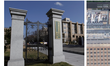
37 医学類門柱(上) メモリアルプロムナード「医学の道」(右) 医学類の門を抜けると、150メートル超のケヤキ並木の遊歩道が広がる。