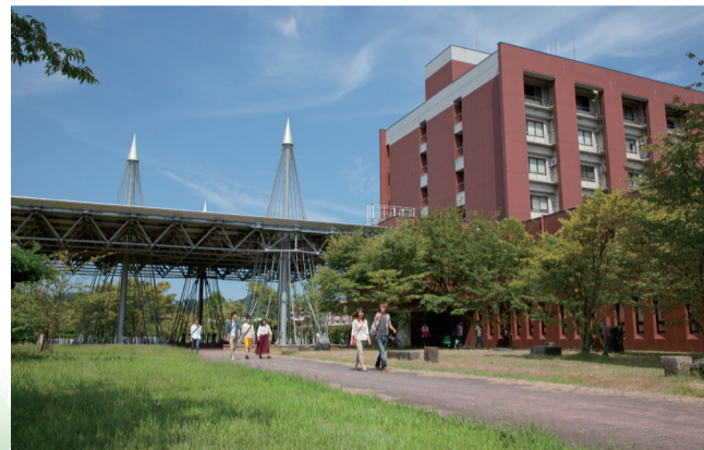
10 自然科学5号館横の大屋根 5号館と南地区をつなぐ通路の大屋根支柱は、冬の兼六園の雪吊りをイメージしたもの。災害時の避難場所として重要な役割も担う。