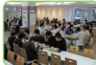
38 39 食堂 日替わりメニューで学生の食生活を支える。 38 医学食堂 MEDEAL (メディー) 【11:30~13:15 ⑤土・日・祝】 39 保健食堂 つるま 【11:30~13:15 ⑤土・日・祝】