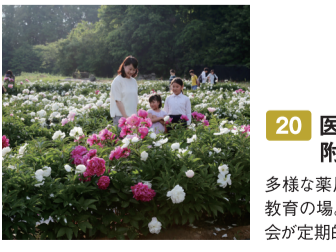
20 医薬保健学域薬学類 附属薬用植物園 多様な薬用植物を栽培する。薬学生教育の場。市民向けの勉強会と観察会が定期的に開催されている。