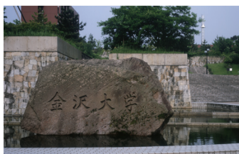
4 金沢大学標石 1996年、キャンパス移転時に「金沢大学」の標石が角間中央に設置された。47トンの戸室石で作られており、金沢大学の顔となっている。