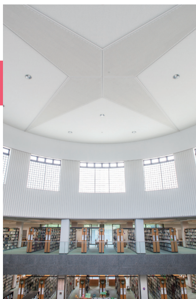
3 中央図書館 四高を引き継ぐ校章「四稜星章」 教養的な図書や人文・社会系の専門書を中心に所蔵し、蔵書数は約121万冊に及ぶ。吹き抜け天井にデザインされている四高の校章を模した北極星も見どころの一つ。 ※最新の開館日時はWebサイトを確認