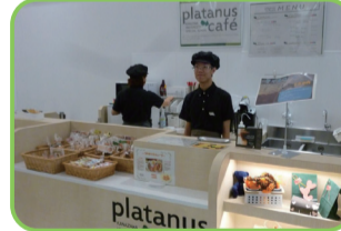
40 プラタナスカフェ 附属特別支援学校高等部の生徒が手作りのクッキーやドリンクを販売している。 【火・木10:30~11:30 ※不定期営業】