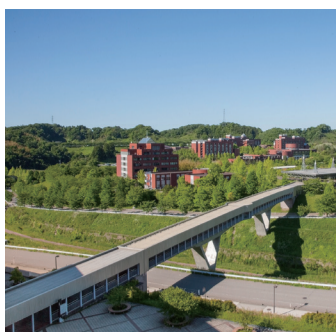
12 アカンサインターフェイス 北地区と中地区、中地区と南地区の間にそれぞれ連絡橋が架けられており、雨や雪の日でも傘を差さずに地区間を移動することができる。