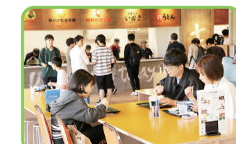
24 ナカフクリ食堂 6つの食のブランドを提供しているフードコート。角間キャンパスの中央に位置し、豊かな自然を体感できるテラス席を備えている。 ◎11:00～17:00(L.O.16:00) ㊦土・日・祝