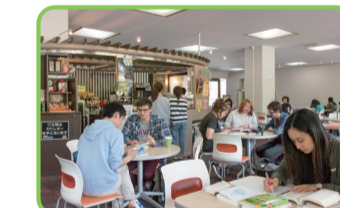
23 ほんわかふえ。 ブックラウンジにあるライブラリー・カフェ。ブータン産のそばを毎朝製粉・製麺するそば処と、自家焙煎コーヒーを提供するカフェを展開。