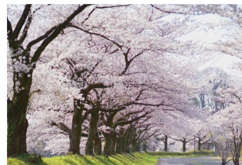
2 プールそばの桜回廊 角間キャンパスの桜の見どころの一つ。ソメイヨシノやヤマザクラなどの総数は約3600本と大学では有数の規模を誇る。