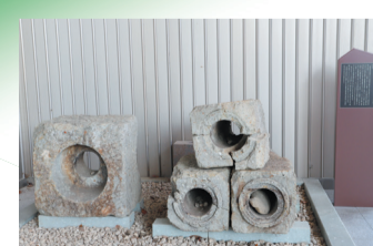
14 辰巳用水の石管 旧石川薬行倉庫新築工事現場の地下から出土した辰巳用水の石管は、金沢城から付近藩邸への給水に用いられたと思われる。