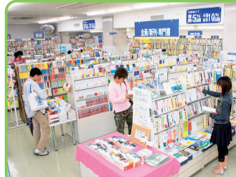
26 27 生協コンビニ 教科書からパソコン、白衣、弁当、飲み物、通学バス定期まで取り扱う。大学ロコ入りのグッズはお土産に最適。 26 学生会館購買 ◎8:00～9:00、9:30～19:00 ㊦土・日・祝 27 南福利購買 ◎9:30～19:00、土9:30～14:00 ㊦日・祝