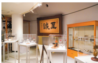
6 資料館 国内屈指のコレクション数を誇る四高由来の物理実験機器など、前身校から継承する資料を収蔵・展示。入館無料。 ◎10:00～16:00 ㊦土・日・祝