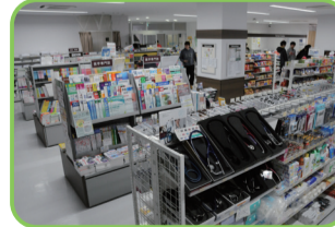
41 42 生協コンビニ 弁当、文具から白衣や実習用の教材まで扱う。 41 医学購買 たからマート 【10:00~15:00 ⑤土・日・祝】 42 保健購買 書籍 つるま 【10:00~15:00 ⑤土・日・祝】