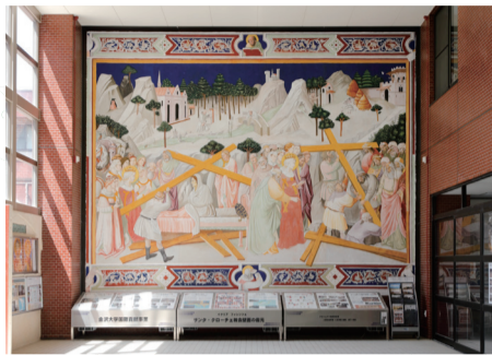
7 フレスコ壁画の再現 イタリアのサンタクロッチェ教会大礼拝堂の修復プロジェクトと並行して原寸で復元した壁画「聖十字架物語」。14世紀末と同じ材料と技法を用いた。