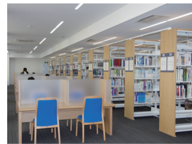
36 医学図書館 書架には医学専門書が並ぶ。蔵書数は約24万冊。前身校から受け継ぐ医学図書も収蔵している。 ※最新の開館時はWebサイトを確認