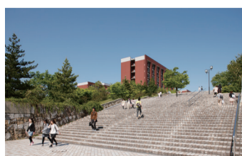
1 大階段 中央バス停から最初に目にする大階段は104段あり、総合教育講義棟や学生会館へとつながっている。登下校時には多くの学生が行き交う。