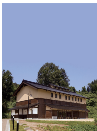
8 創立五十周年記念館「角間の里」 旧白峰村から築300年の古民家を移築し整備された。金沢大学の社会連携活動の拠点。 ◎9:30～16:00 ㊦月・日・祝