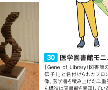
30 医学図書館モニュメント 「Gene of Library(図書館の遺伝子)」と名付けられたブロンズ像。医学書を積み上げた二重らせん構造は図書館を表現している。