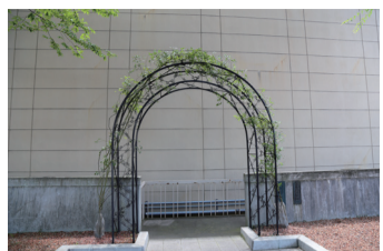
32 荊棘の門 医学部卒業生から、「医学の道こそ「荊棘の道を開く」ことにある」との意を込めて贈られた、かつての学生専用門。バラが植樹されている。