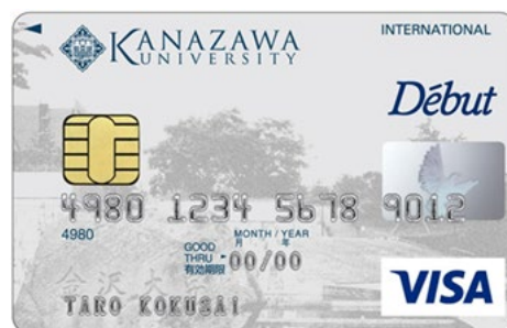
金沢大学カード（デビューカード）

また、利用者の負担がなく、カードを利用してショッピングすることでカード加盟店手数料の一部がカード会社から金沢大学基金へ寄附され、在学者の留学支援金等に役立っています。