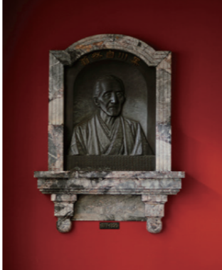
34 黒川良安像 金沢大学の源流である加賀藩彦三種痘所を開設した蘭学者黒川良安。医学の知識・技術の修得に励む学生を見守っている。