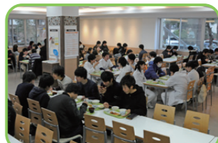
41 42 食堂 日替わりメニューで学生の食生活を支える。 ① 医学食堂 MEDEAL(メディーアール) ② 11:00~13:30 ※土11:00~13:00 ③ 日・祝 ④ 8:30~22:00 ※土10:00~16:00 ⑤ 日・祝 ※学期休業期間の開催日時は要確認