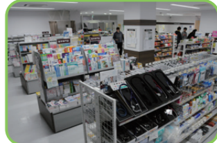
44 45 生協コンビニ 弁当、文具から白衣や実習用の教材まで扱う。 ① 医学購買 たからマート ② 9:30~17:00 ※土9:30~14:00 ③ 日・祝 ④ 保健購買 書籍 つるまーと ⑤ 9:30~17:00 ※土9:15~14:00 ⑥ 日・祝