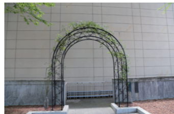
35 荊棘の門 医学部卒業生から、「医学の道こそ「荊棘の道を開く」ことにある」との意を込めて贈られた、かつての学生専用門。バラが植樹されている。