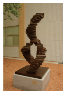
33 医学図書館モニュメント 「Gene of Library(図書館の遺伝子)」と名付けられたブロンズ像。医学書を積み上げた二重らせん構造は図書館を表現している。