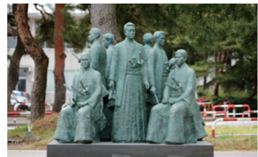
31 医学部創立百五十周年記念モニュメント 金沢医学部第一期生9名をモチーフにしたブロンズ像「医の源流 未来への継承」。金沢大学草創期の息吹をキャンパスで学ぶ学生たちに伝える。