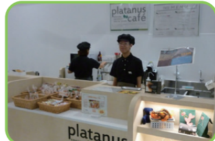
43 プラタナスカフェ 附属特別支援学校高等部の生徒が曜日限定で手作りのクッキーやドリンクを販売している。 ① 火・木10:30~13:00 ② 月・水・金・土・日・祝