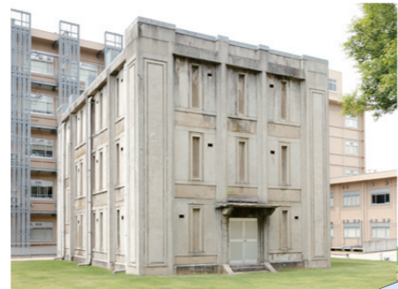
32 医学類旧書庫 1926(大正15)年に竣工したキャンパス最古の建物。医学類教育棟・E棟・F棟・G棟に囲まれた中庭にある。