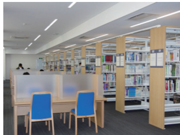
39 医学図書館 書架には医学専門書が並ぶ。蔵書数は約24万冊。前身校から受け継ぐ医学図書館も収蔵している。 ①11:00~13:30 ※土11:00~13:00 ②日・祝 ③8:30~22:00 ※土10:00~16:00 ④日・祝 ※学期休業期間の開催日時は要確認