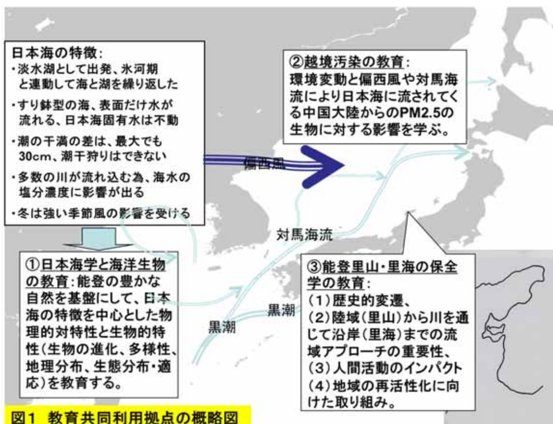
図1 教育共同利用拠点の概略図

能登半島は、人々の営みにより形成された、豊かな里山・里海の自然と伝統文化、美しい景観に恵まれており、『世界農業遺産』に認定された(平成23年6月)。しかし、近年、農林水産業の不振、過疎・少子・高齢化の急速な進行によって、集落や地域社会の維持すら困難なところが出現している。自然と人の共生教育における里山・里海の重要性が注目されているが、まとまった講義や野外実習の機会は少なく、本施設で行う実習は他大学にはない特徴的なものであり、以下を骨子として、講義、エクスカージョン、地域住民との交流により理解を高める。(1)能登半島の里山里海の歴史の変遷、(2)陸域(里山)から川を通じて沿岸(里海)までの流域アプローチの重要性(里山里海の連環)、(3)人間活動のインパクト(大規模開発、乱伐、管理放棄等)、(4)地域の再活性化に向けた取り組み(地域・行政・民間と大学の連携)とシナリオ(環境配慮型の農林水産業、バイオマス等の活用技術の開発等)を教える。