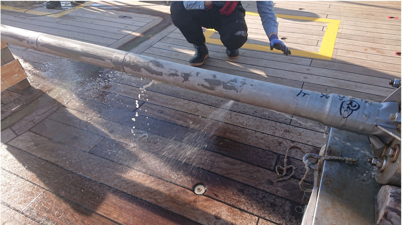
図2 ピストンコアラーから噴き出した海水