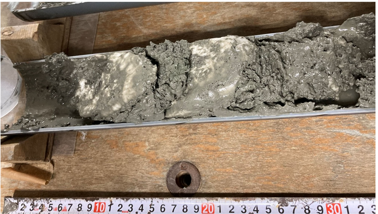
図3 採取されたメタンハイドレート（白い固体状の部分がメタンハイドレート）