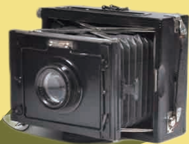
『デクルロー・ネットル』: 四高の教授が所有していたクラップカメラ。来日中のアインシュタインを撮影したことも。