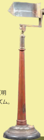
『三稜柱硝子』:「三稜柱硝子」(明治11年:文部省贈), 別名プリズム。光を“分ける”実験道具。

先人たちは、光を生活に取り込むことを“こころざし”, いろいろな目的に合わせて活用した。