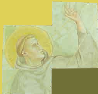
『水彩による原寸大模写「聖フランチェスコ」(イタリアフィレンツェサンタクロチェ教会大礼拝堂アーチ右壁面「フランチェスコの聖痕拝受」)』: 聖痕を拝受する聖フランチェスコ。資料は大村正章教授による同教会の壁画模写。

光を表現の手段として用いた先人たち。彼らは、何を“おもい”, 何を“かんがえ”て「光」を作り出したのか。