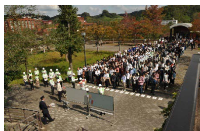
一次避難場所（中地区）