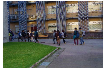
一次避難場所へ移動（南地区）