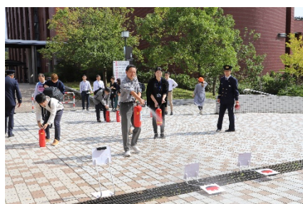
消火器を使った消火訓練（角間）（宝町）