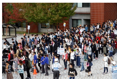
一次避難場所（大学会館前）