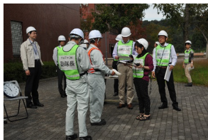
自衛消防地区隊（中地区）