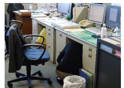
身の安全を確保（角間）