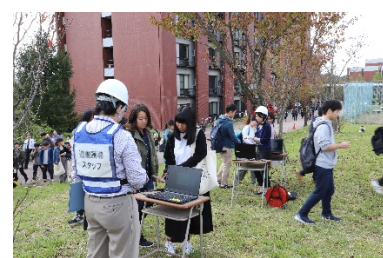
一次避難場所（北地区）