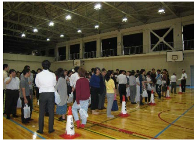
一次避難場所（南地区）