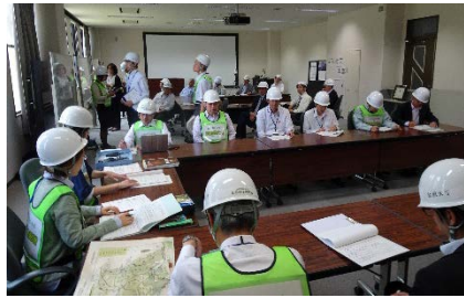
自衛消防本部（角間）