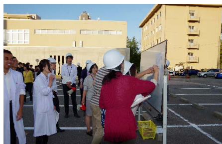
避難者数の確認（宝町）