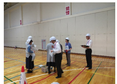
避難者数の確認（鶴間）