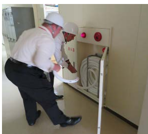
初期消火活動（宝町）