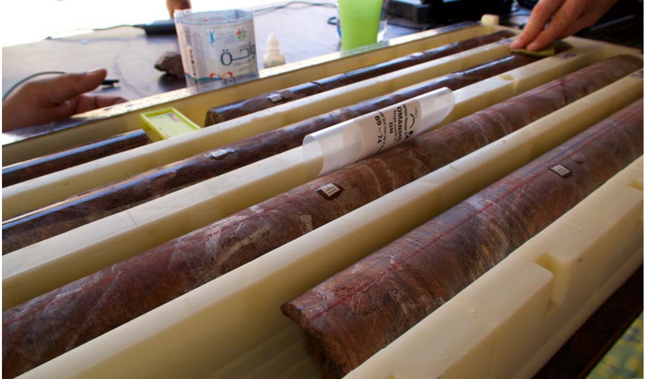
写真：オマーンオフィオライト基底部の炭酸塩岩化した変かんらん岩（listwanite）