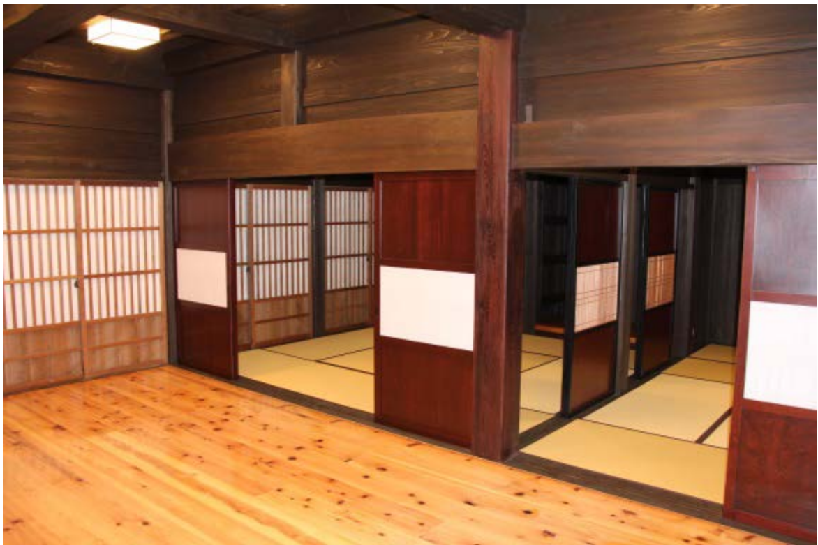
金沢大学五箇山セミナーハウス内装