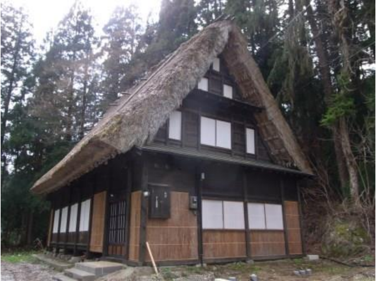
金沢大学五箇山セミナーハウス外観