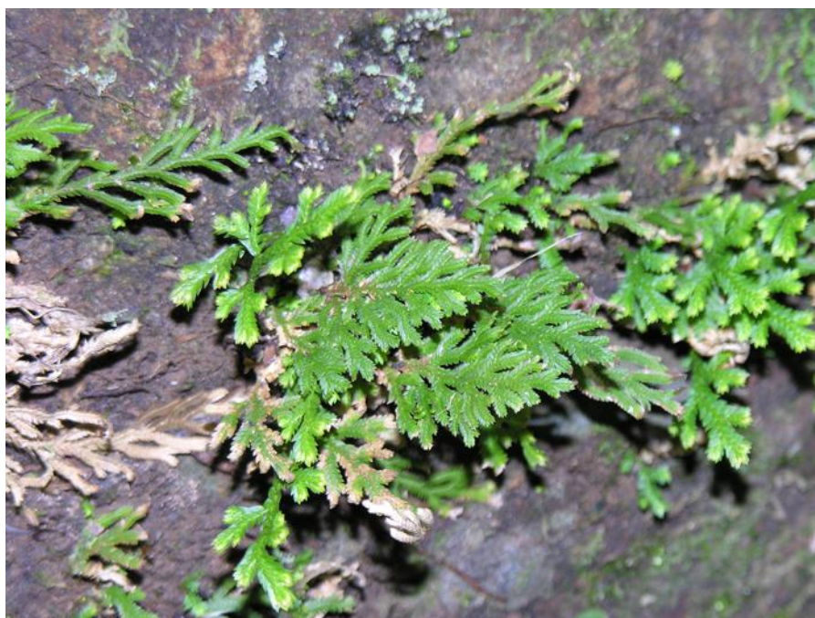
図1 シダ植物小葉類イヌカタヒバの自生写真（沖縄県西表島）

シダ植物・コケ植物は作物などの被子植物の持っていないたくさんの有用な性質を持っています。例えば、乾燥耐性能力や再生能力、耐病虫害性は被子植物よりもずっと優れています。今回の研究で遺伝子のリストができたことから、今後、これらの働きを司る遺伝子を解析することが容易になります。将来的には、作物に有用な性質を付与し品種改良することに役立つものと期待されます。