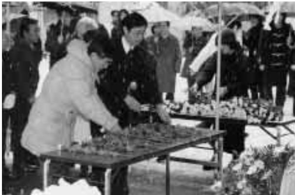
雪が舞う中、順次献花を行う関係者 = 12月21日、医学部附属動物実験施設前で

このたび、医学・薬学発展のため小さな命を捧げた実験動物の慰霊碑が建立され、12月21日、医学部長をはじめとする関係教職員・学生ら170人余りが参加して、除幕式が行われた。また、引き続き執り行われた慰霊祭では、教育研究のための実験に供された動物たちの霊に対し、参加者全員で黙とうをし、それぞれの想いを巡らせていた。