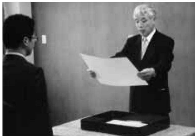
学位記を授与する林学長 = 同左