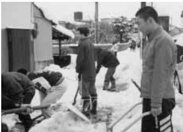
一致団結して除雪を行う寮生 = 12月21日、北溟寮前で