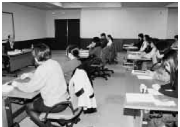
公文書の作成について学ぶ = 12月8日、事務局大会議室で