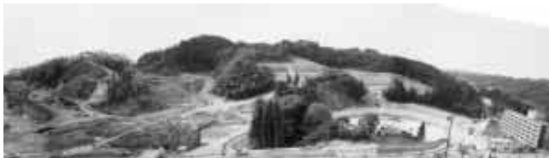
平成11年11月，造成前の樹木伐採