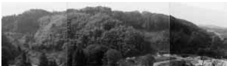
平成10年10月，工事着手前