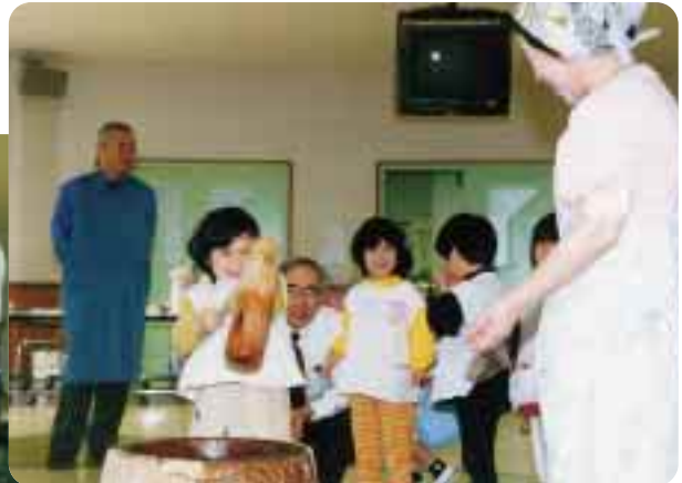
小さな身体で重たい杵 きね をよっこらしょ！