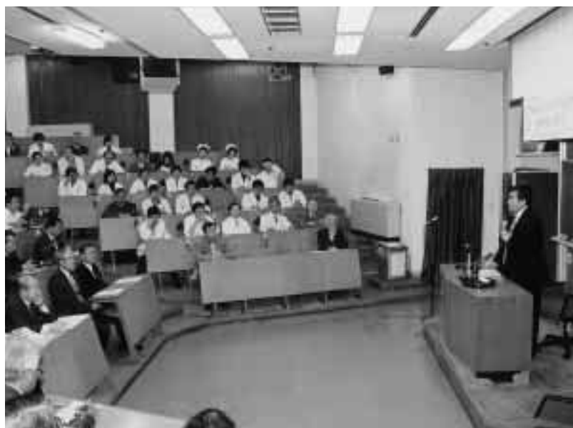
医学系を中心にたくさん集まった教職員 = 12月8日、医学部で