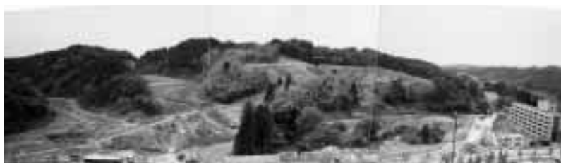
平成11年5月，調整池築提工事中