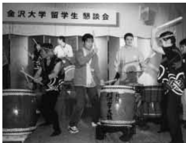
外国人留学生も飛び入りで参加した太鼓の様子 = 12月14日，KKRホテル金沢(金沢市大手町)で

懇談会では，外国人留学生による歌，本学吹奏楽団によるサックス4重奏，ボランティア団体による太鼓が披露された。