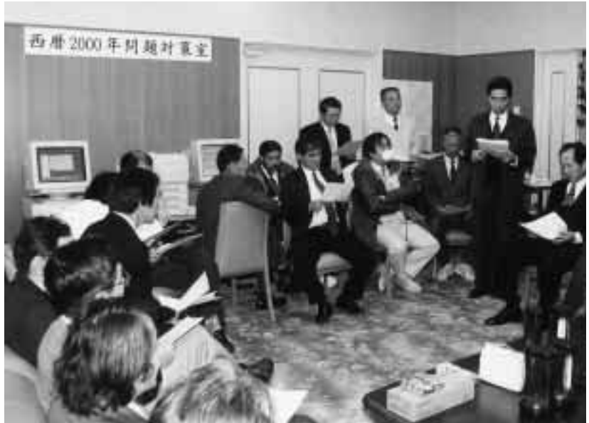
問題が発生した場合の対処等について、打ち合わせする関係職員 = 12月28日、角間ゲストハウスで