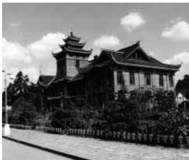
華西医科大学第四教学楼

同大学は、現在9か国約40大学と大学間交流協定を締結するなど国際交流にも積極的であり、本学にとっても、本協定を介した交流の一層の発展が望まれる。