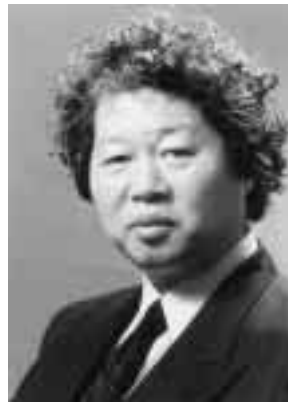
特別講演の講師に決定した立花隆氏 (評論家)

来年の創立50周年記念式典まで、残すところあと1年となり、創立50周年記念事業委員会では、記念式典・祝賀会、50周年記念展示、国際シンポジウム、特別講演及び若手研究者シンポジウムの日程、会場等を決定した。(下表のとおり。)この中で、特別講演の講師には、中身の濃い評論に定評があり、このたび第1回司馬遼太郎賞を受賞した評論家の立花隆氏を迎えることとなった。