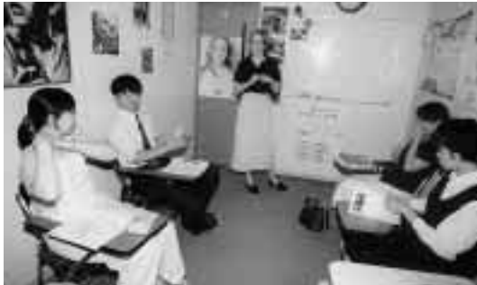
「中級コース」のリラックスした研修風景 = 5月26日, イーオン金沢校(金沢市片町)で

期 日：5月7日～12月24日(「中級コース」) 受講者：簡単な英会話や英語での意見表明ができる者など 4名 場 所：イーオン金沢校(金沢市片町)