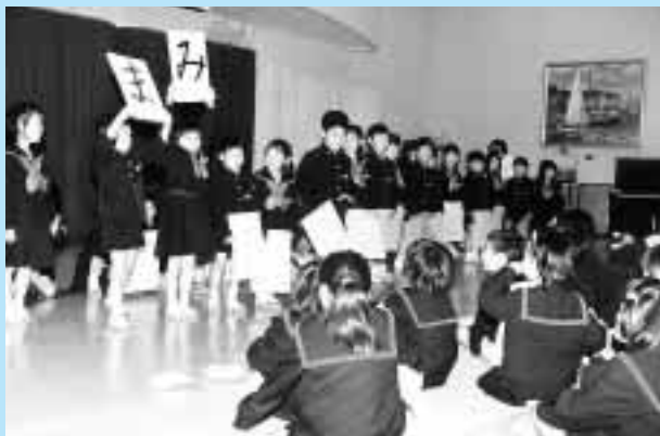
「ことばあそび」をする1年3組の児童たち = 5月13日、附属小学校ランチルームで

教育学部附属小学校は、5月13日、恒例の「ふじだなおとぎ会」を開いた。これは、校内にある立派な藤棚の下で日頃練習した出し物を披露する会であるが、この日は、あいにくの雨模様となり、会場をランチルームに移して行われた。元気いっぱいの演技やときどきのハプニングに友達や保護者は歓声をあげて楽しんだ。