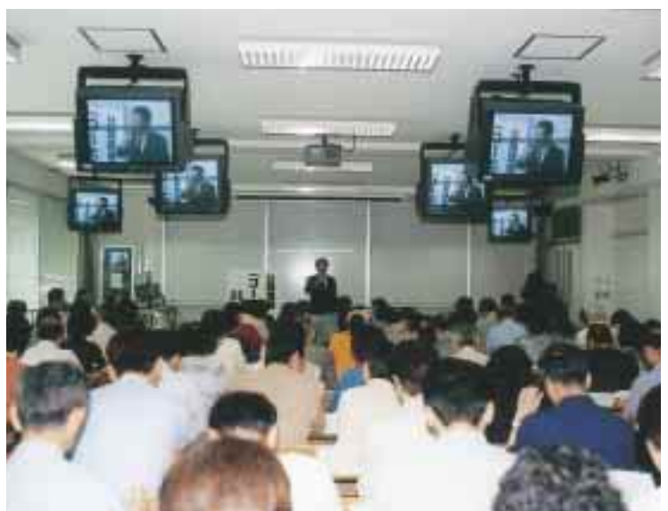
たくさんの受講者が集まった初回の講義の様子 = 同上

講座では、全日本コーヒー協会のインストラクターがおいしいコーヒーの入れ方を紹介するほか、工学・歴史・経済学・農学などの各専門家がそれぞれの立場で「コーヒー」について語ることとなっている。