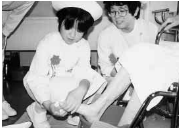
患者さんの足を丁寧に洗ってあげる一日看護婦さん = 5月9日、医学部附属病院病室で