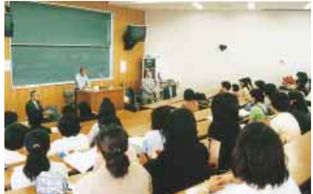
個別の模擬面接を前にしてのオリエンテーション = 5月28日、教育学部401講義室で

厚生課と教育学部は、5月28日に教員志願者のためのガイダンスを開いた。講師に石川県教育委員会のOBを迎えて集団と個別による模擬面接を行ったものであるが、就職戦線たけなわの中、多くの学生が真剣に受講した。