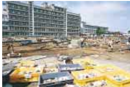
附属病院 = 埋蔵文化財を調査中