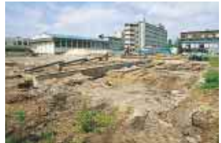
医学部保健学科 = 埋蔵文化財を調査中