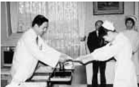
一日看護婦に任命される高校生 = 5月12日、医学部附属病院院長室で

当日は、親子2組を含む9名が参加して、病院内の施設や医療機器の見学、患者さんの入浴介助、ベッドメイキングなどが行われた。参加者からは、「看護婦の仕事の多様さに驚いた。」「看護婦になりたい気持ちがより強くなった。」などの感想が寄せられた。