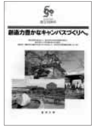
記念事業を紹介するリーフレット