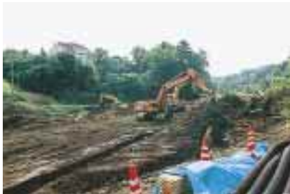
総合移転 = 角間川を改修中