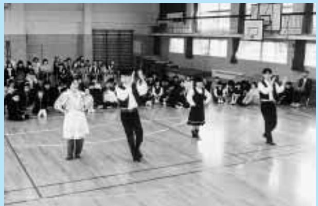
軽快なリズムに合わせて踊る民族舞踊部の皆さん = 5月11日、附属養護学校体育館で