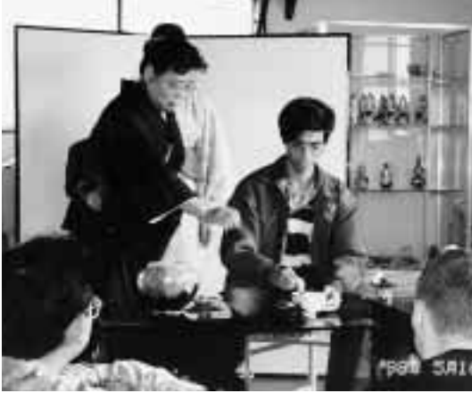
見よう見まねでお茶をたてる様子 = 5月16日, 越田師範宅(小松市)で