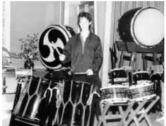
楽しげに太鼓を打ち鳴らす外国人留学生 = 5月16日, 浅野太鼓店(松任市)で