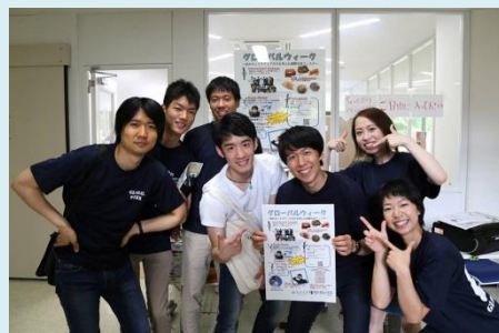
“KU-SGU Student Staffたち”

また、イベントの一環として、金大生協に協力いただき、期間中、本学各キャンパスの食堂において、イギリスのフィッシュアンドチップス、インドネシアのビーフレンダン、ウクライナのボルシチ等、多国籍料理