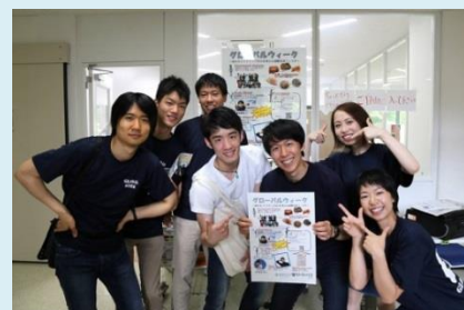
“KU-SGU Student Staff”

KU-SGU Student Staff and other Japanese and international students of Kanazawa University hosted a university-wide scale event, “Global Week ~ International Exchange Festival for your career development ~ ” in order to increase momentum for globalization among students. More than 10 international exchange events such as game party, exchange party, workshops, etc., were held throughout the week. Participants enjoyed experiencing international exchange that cannot be found in everyday life and acquired a global perspective. Approximately 400 students joined this event in total. In addition, as a part of this event, meals from various countries such as Fish and Chips (UK), Beef Rendung (Indonesia) and so on, were provided at the University cafeterias in cooperation with the Kanazawa University Co-operative. On the last day, in relation to Premium Friday (*), “KU Premium Friday < Exchange event for Students · International Students · Faculty and Staff >” took place. The members of Student Staff were relieved as the events ended in success. We hope that the students who participated in those events will go abroad in the near future!