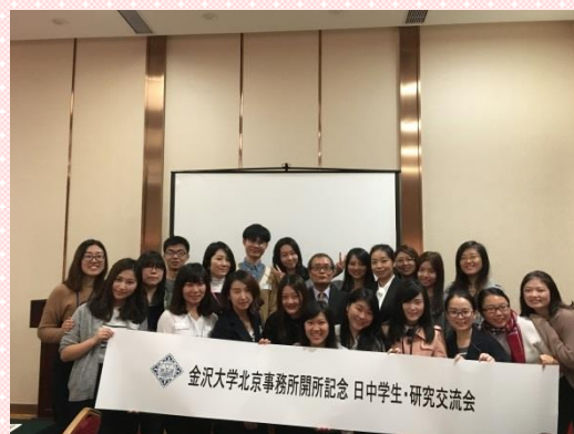
“研究交流会での様子”

中国北京市朝陽区亮馬橋路40号中日青年交流中心 TEL: (86-10)8598-1980, (86-10)6466-9162 FAX: (86-10)8571-8521 E-MAIL: beijing04@studyinjp.com