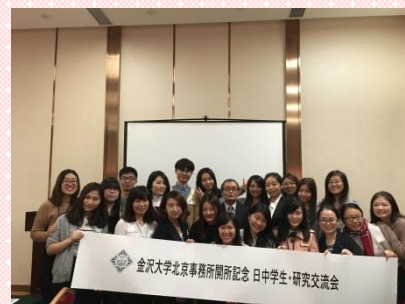
"Participants in the research exchange conference"

40 Liangmaqiao Rd, Chaoyang District, Beijing TEL: (86-10)8598-1980, (86-10)6466-9162 FAX: (86-10)8571-8521 E-MAIL: beijing04@studyinjp.com