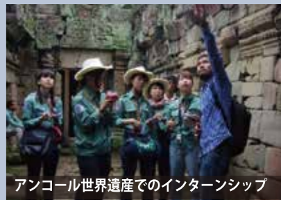
アンコール世界遺産でのインターンシップ