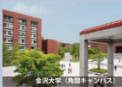
金沢大学（角間キャンパス）