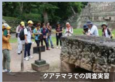
グアテマラでの調査実習