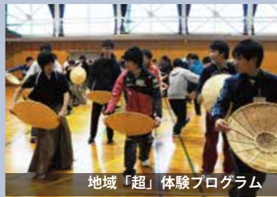
地域「超」体験プログラム