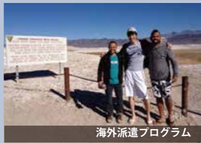
海外派遣プログラム