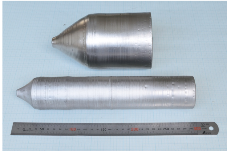
写真 1:手前が直径2インチ直胴 25 センチ、奥が直径 4 インチ直胴 10 センチの Fe-Ga 単結晶インゴット(*7)

なお、本研究は、科学技術振興機構(JST)の戦略的創造研究推進事業チーム型研究(CREST)「微小エネルギーを利用した革新的な環境発電技術の創出(研究統括:谷口研二(大阪大学 名誉教授))」の研究課題「磁歪式振動発電の実用化に向けた革新的メカニズム・材料の創成(代表研究者:上野 敏幸(金沢大学))」と東北大学出資事業BIP(ビジネスインキュベーションプログラム)の支援を受けて行われました。